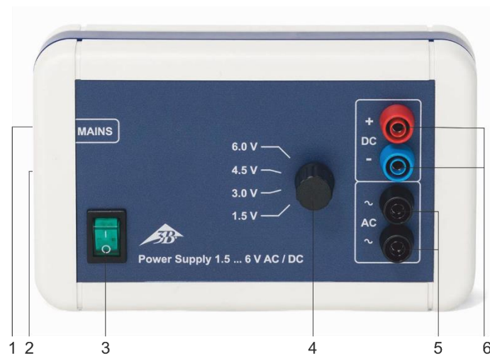
Fig. 1 Bedienelemente