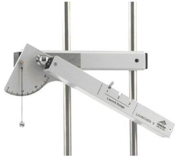
Fig. 2 Experimenteller Aufbau schräger Wurf