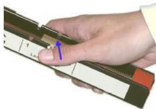
Fig. 1 Auslösen der Abschussvorrichtung