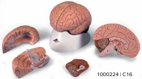
1000224 | C16