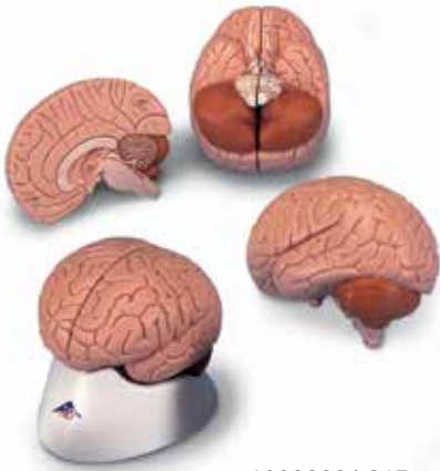
1000222 | C15